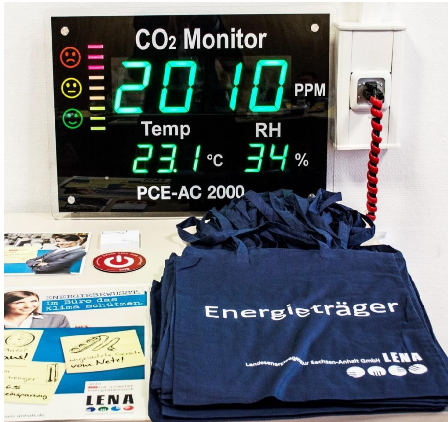
Materiais para multiplicadores de energia