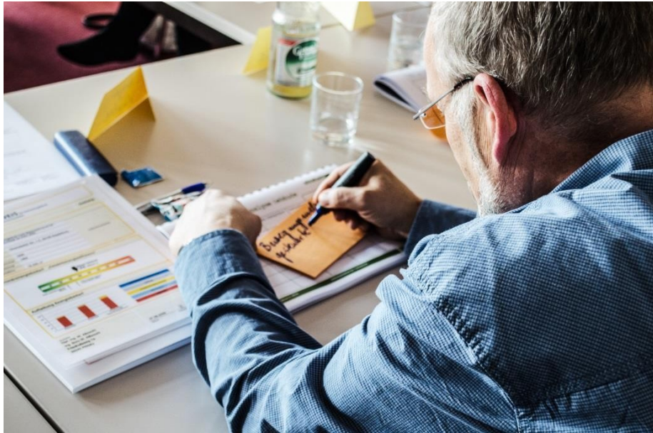
Oficina de impressão 01