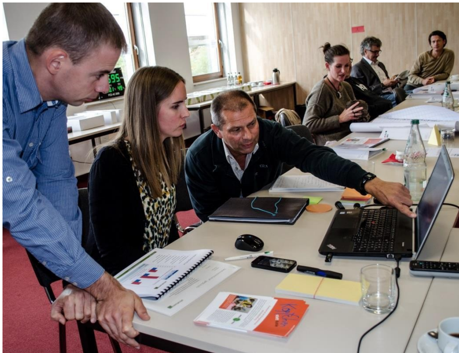
Workshop de impressão 2